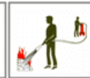
Розпочати гасіння пожежі.