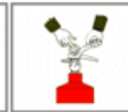
Зірвати пломбу, висмикнути чеку.