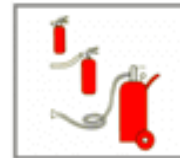
Направити сопло або стовбур-насадок на осередок пожежі.

Палаючий двигун, електропроводку рівномірно вкрити сумішшю вогнегасника.